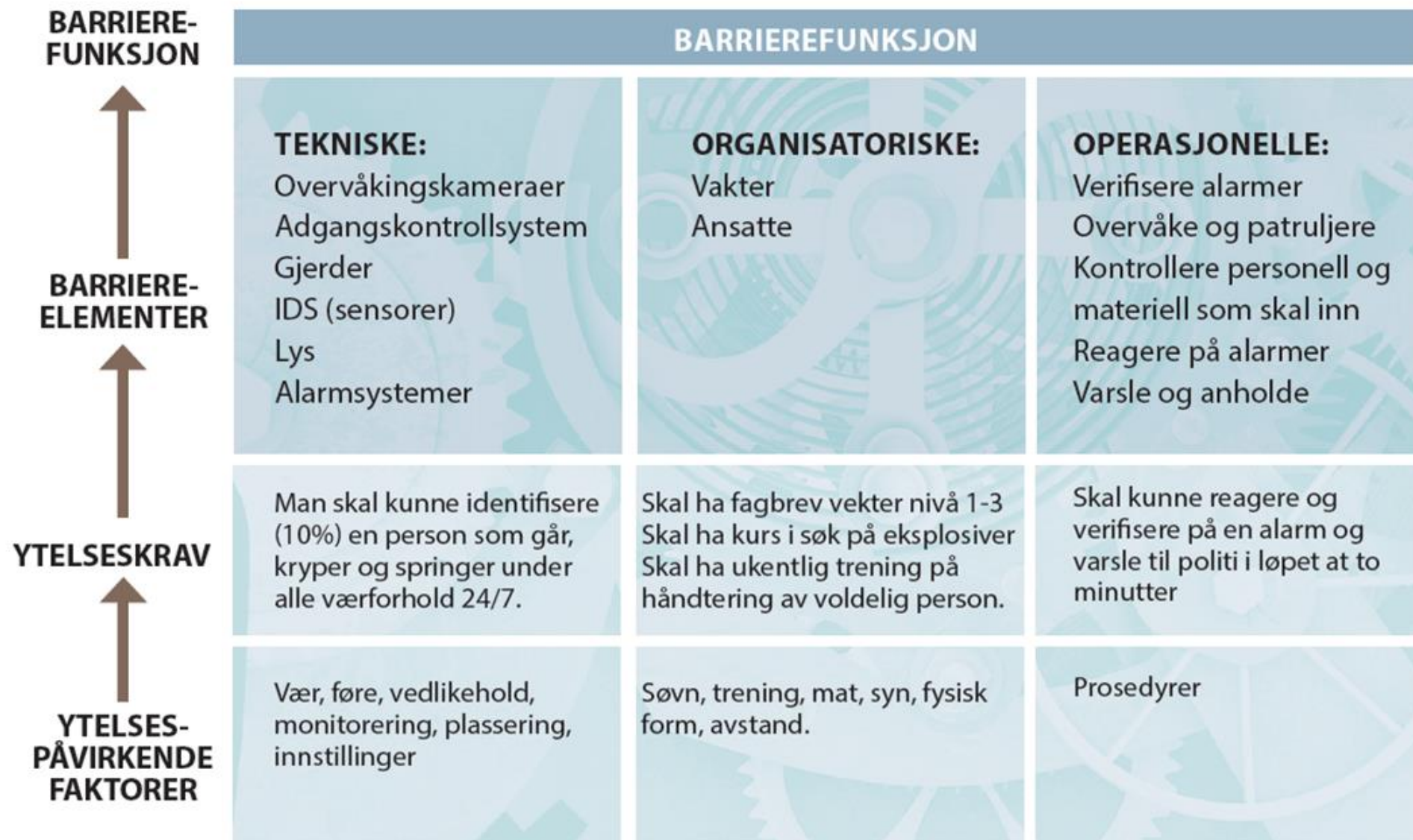
Figur 13: Eksempel på tekniske, organisatoriske og operasjonelle barriereelementer som inngår for å ivareta barriererefunksjonen «Hindre uautorisert adgang». Figuren viser også eksempler på ytelseskrav og ytelsepåvirkende faktorer.