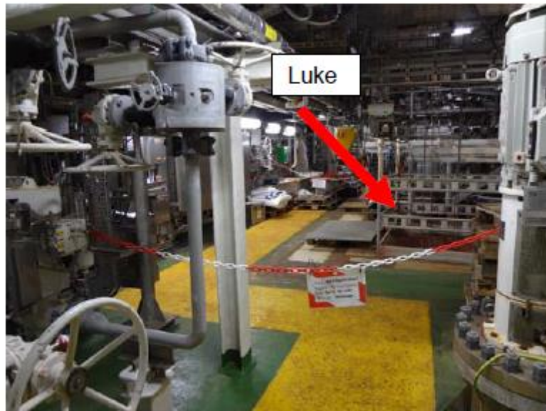
Dette bildet viser mellomste nivå, Cellardekk.